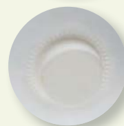
Válvula de exalação.