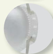
Fita dupla de ajuste.